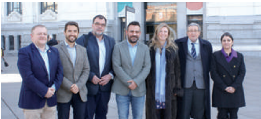
Foto de familia tras la última reunión.

citado Plan Estratégico, o las vigésimas jornadas sobre colaboración de las Policías Locales y las Fuerzas y Cuerpos de Seguridad del Estado -respuesta policial ante el terrorismo yihadista-) y que ha incluido también la elaboración del documento marco para la creación de grupos locales de lucha contra la radicalización violenta, así como la celebración de una Mesa de trabajo, en colaboración con la Embajada de Canadá, sobre la prevención de la radicalización.