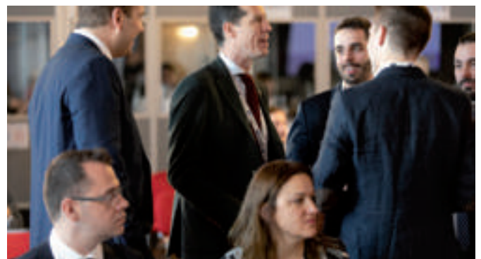
Algunos de los jóvenes españoles presentes en Bucarest.