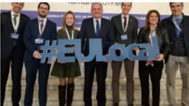
Parte de la delegación española en la Cumbre.

Para lograr estos y otros retos como la reducción de las emisiones de dióxido de carbono en la zona común, las autoridades presentes en esta Cumbre recordaron a través de este texto la necesidad de dejar un margen de maniobra suficiente a las autoridades locales y de dotar con un presupuesto realmente ambicioso capaz de responder a las necesidades reales de la ciudadanía y a los retos que Europa, esa que va desde el municipio más pequeño hasta la sede más imponente, deberá enfrentar el día de mañana.