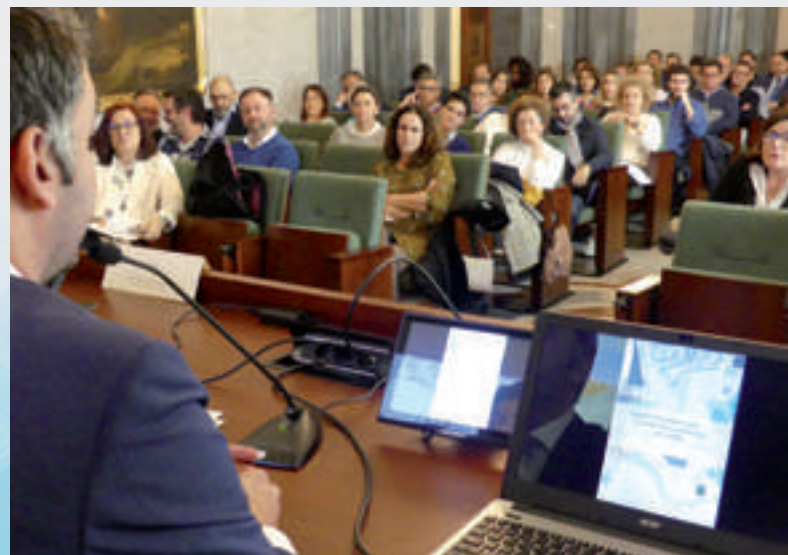
Presentación en Sevilla.

Durante el encuentro sevillano, el Vicepresidente de la FAMP destacó que existe consciencia de que “la Administración debe inspirarse en criterios de rentabilidad asociados al coste-beneficio y por ello se hace necesario dar a conocer este modelo de compra ya que aborda una gestión más sostenible de los recursos públicos desde un respeto medioambiental que beneficiará a la ciudadanía y a la propia Administración Local” .