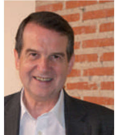
Abel Caballero Álvarez Presidente de la FEMP

De todo esto dan cuenta nuestras páginas interiores, y también de manera más inmediata, la web de la FEMP ( www.femp.es ) y la red social Twitter (@fempcomunica) en la que, desde el 22 de febrero, quedan recogidas en vídeo las impresiones de aquel que fue el punto de partida para la democracia local.