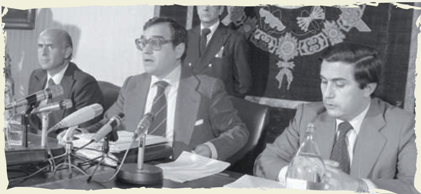
El Ministro del Interior, Rodolfo Martín Villa, en la rueda de prensa posterior al recuento de resultados.