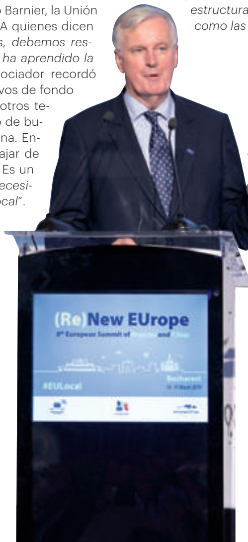
El negociador jefe del Brexit, Michel Barnier, en la Cumbre.