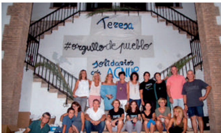
Teresa (Castellón) Pueblo Solidario con ACNUR.

Esta primavera se inicia la actividad de la Red involucrando a más municipios a través de sus alcaldías, concejalías, peñas, asociaciones, vecinos y vecinas que quieran sentir #OrgulloDePueblo.