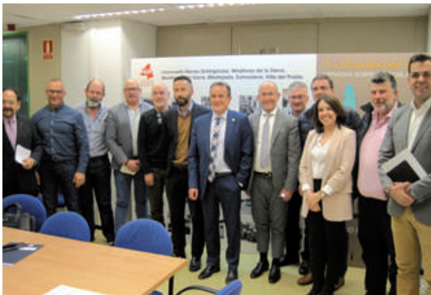
Los miembros de la Comisión en su última reunión.

Esos asuntos forman parte de un devenir diario que conocen bien los 25 electos locales, que enfrentaron lo posible desde la firmeza de sus convicciones. El resultado de ese trabajo compartido fue alcanzado en un tiempo muy breve y plasmado en el documento que recoge la lista de 79 acciones, ideas que orientan sobre qué debería hacerse para que la situación de desigualdad generada por décadas de crisis territorial pudiera, al menos, revertirse.