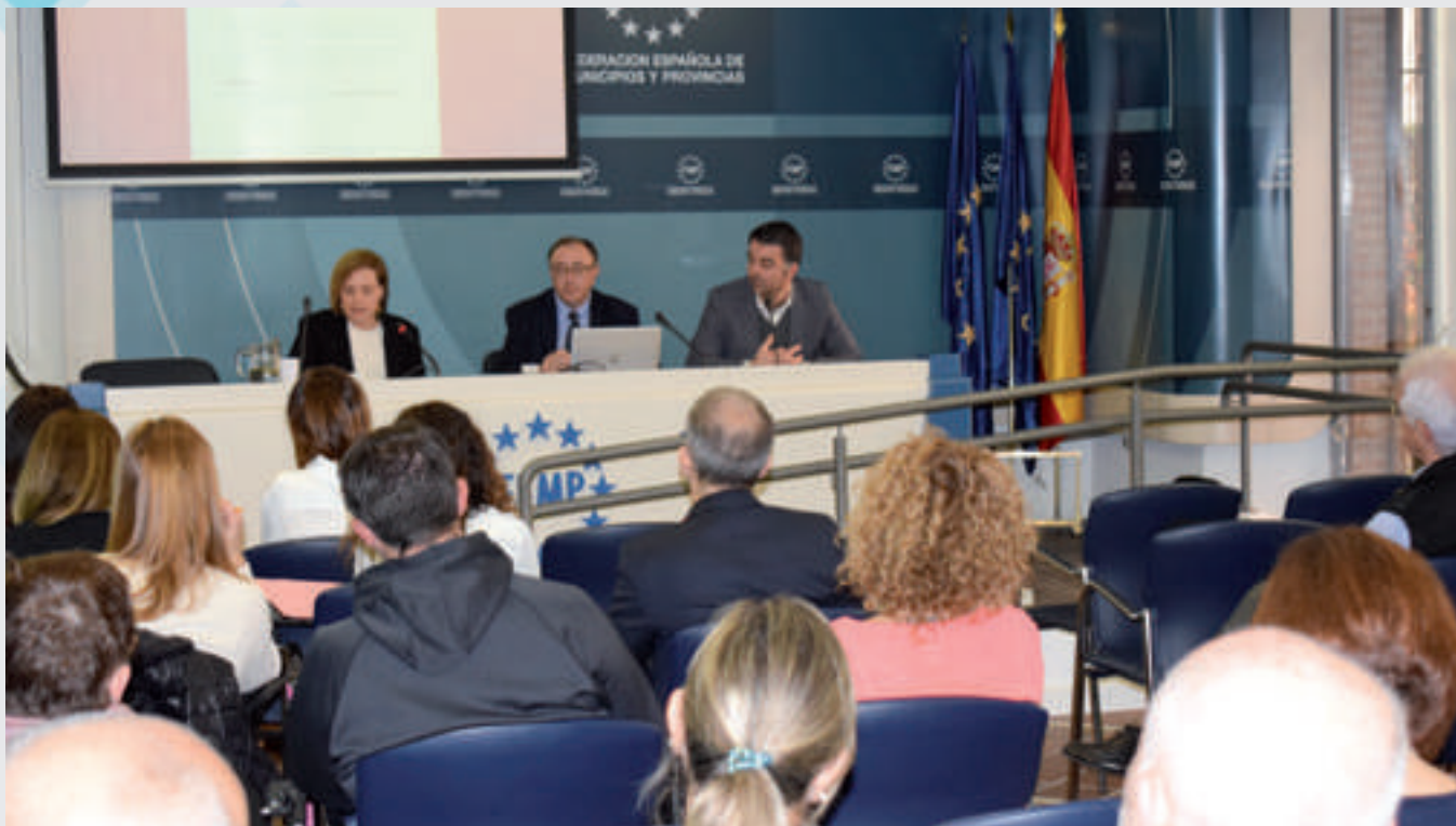
Jornada celebrada en la sede de la FEMP.