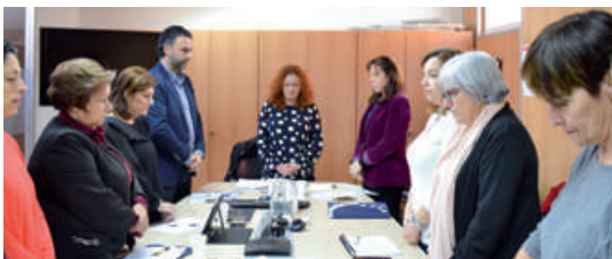
La Comisión guardó un minuto de silencio por las víctimas de Violencia de Género.

Ha sido un mandato, en el que los Ayuntamientos han recuperado sus competencias en materia de igualdad y en la lucha contra la violencia de género, reforzando así la legitimidad de las políticas llevadas a cabo a pesar de la aprobación de la LRSAL y que ha supuesto el reconocimiento de la importancia de la cercanía a las personas como una de las claves más eficaces para erradicar la desigualdad entre hombres y mujeres.